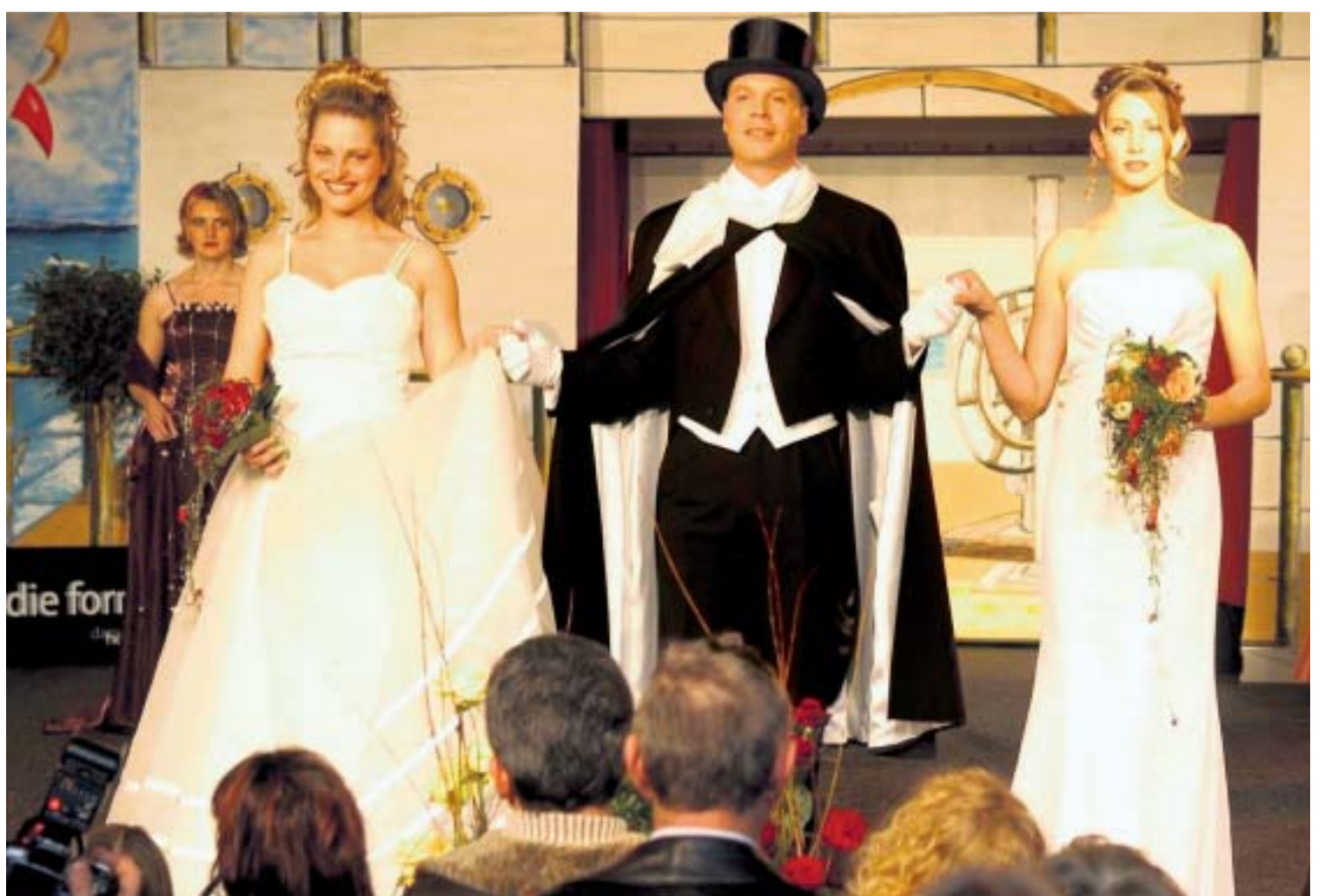
Ein Bräutigam mit zwei Bräuten? Bei den Modenschauen auf der Hochzeitsmesse in der Weser-Ems-Halle ist diese Kombination ausnahmsweise einmal erlaubt.

OLDENBURG. Ikea kommt nach Oldenburg. Am Montag hat der Stadtrat einstimmig (bei einer Enthaltung) den Bebauungsplan für das 40-Millionen-Euro-Projekt an der Holler Landstraße abgesegnet. Danach darf das schwedische Unternehmen auf 27.300 Quadratmetern Möbelleinzelhandel betreiben, davon können 5000 Quadratmeter für so genannte „zentrale relevante Randsortimente“ genutzt werden – etwa Elektrokleingeräte oder Bürowaren. Hinzu kommen ein Bau- und Gartenfachmarkt auf 11.700 sowie ein Küchenmarkt auf 3.300 Quadratmetern Fläche. Voraussetzung für die Ikea-Ansiedlung war der Bau des ECE-Einkaufszentrums „Schlosshöfe“, der Ende vergangenen Jahres (wie berichtet) beschlossen worden war.